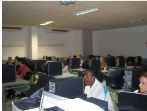
Alumnos de la Escuela de Relaciones Laborales. Universidad de Almería.