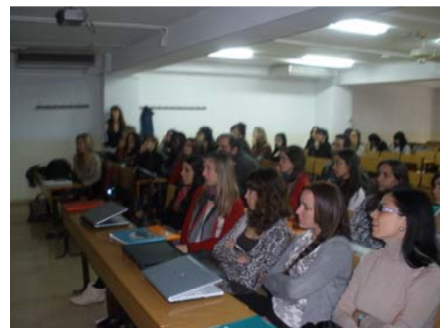
Alumnos de la Escuela de Trabajo Social. Universidad de Almería.